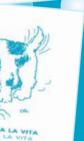
Alcune immagini della campagna di informazione per la Carta sanitaria ticinese